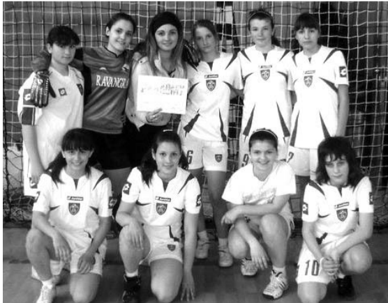
Ученице ОШ „Аврам Мразовић“ - сребро у малом фудбалу